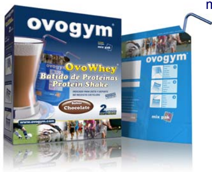
Estuches con 2 mix pak