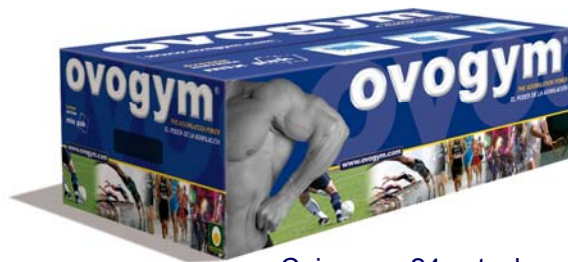
Cajas con 24 estuches