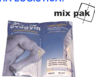
Mix pak de 121 gr.