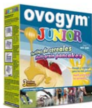
Estuche con 3 mix pak