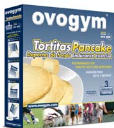
Estuche con 3 mix pak