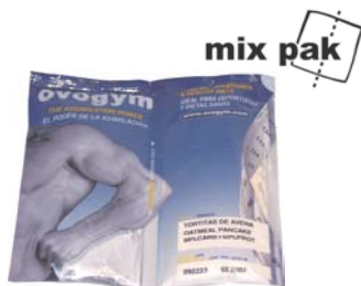
Mix pak de 121 gr.